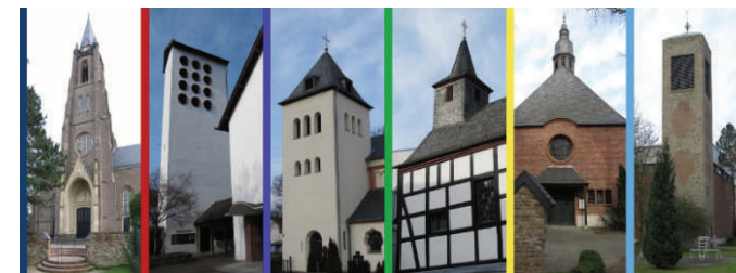
Kirchen und Kapellen der Pfarrgemeinde