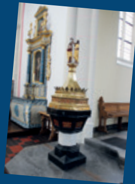
... Restaurierung der Figuren des Taufbeckens