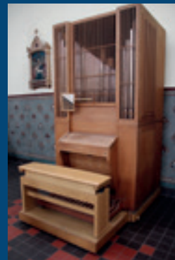
... Orgel der ehemaligen Hügelkirche restauriert