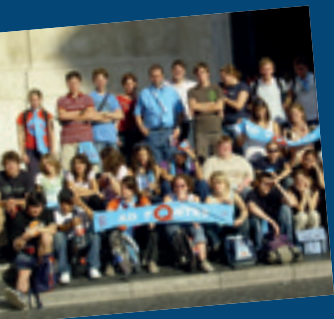
... Unterstützung für die Romfahrt der Messdiener