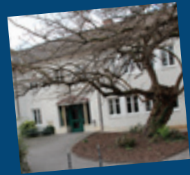
... Renovierung und Ausbau des Pfarrheims