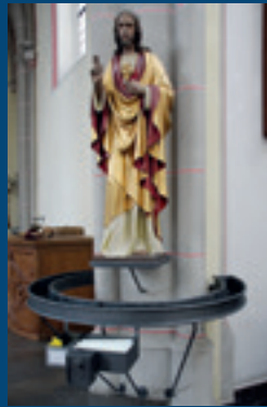
... Herz-Jesus-Statue restauriert und Anschaffung des Kerzenständers

Seit 1974 unterstützt der Freundeskreis finanziell diverse Projekte in unserer Pfarrkirche und unserem Pfarrheim. Die größten waren der Neubau des Pfarrheimes in 1992, Sanierung der Kirche 2001/2002, die Orgelrestaurierung und die Erneuerung der Heizung im Jahre 2007. Insgesamt hat der Freundeskreis bis Ende 2012 mit über 500.000,- € aus Mitgliedsbeiträgen und Spenden zahlreiche Maßnahmen unterstützt.