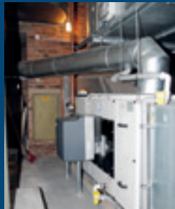
... Erneuerung der Heizung