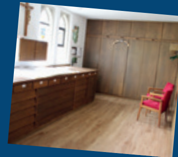
... Renovierungsarbeiten Sakristei: Fußboden, Malerarbeiten, Beleuchtungsanlage