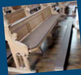
... Kniebänke gepolstert und Sitzbänke mit Sitzkissen ausgestattet