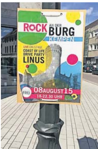
Plakate werben für das das Mini-Festival an der Burg.

rat: Die Amnesty-International-Gruppe Kempen-Nettetal organisiert für den nächsten Freitag, 8.30 bis 17.30 Uhr, und Samstag, 10 bis 15.30 Uhr, im Kempener Rathausfoyer einen Bücherflohmarkt zugunsten der Menschenrechtsorganisation. Bücherspenden für den Verkauf können am Donnerstag in der Zeit von 10 bis 17 Uhr im Gebäude am Buttermarkt abgegeben werden.