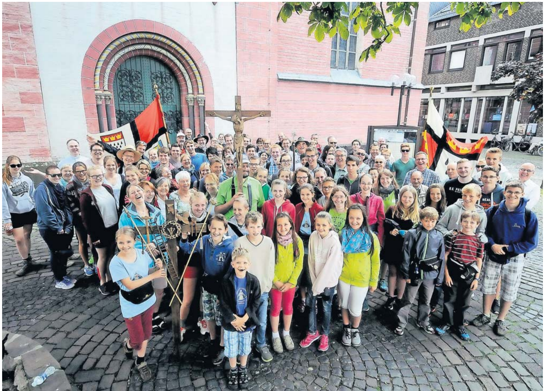
Gut gelaunt zeigten sich die Kölner Pilger gestern Vormittag an der Propsteikirche. Vor ihnen lag eine Tagesetappe bis nach Kaarst. Morgen Abend sind sie wieder in ihrer Heimatstadt.

Etwas für die Beine und den Bauch gibt es am Montag, 14. September, an der Judenstrasse 9. Unter dem Motto „Drill & Grill“ startet dort um 15 Uhr das mittlerweile traditionelle Radtraining über eine Strecke von 60 Kilometern. Begleitet wird die Fahrt durch den früheren Kölner Radprofi Marcel Wüst, Teilnehmer bei Tour de France, Giro d'Italia und Vuelta a España. Mitfahrer in Kempen sollten in der Lage sein, die Strecke mit einer Durchschnittsgeschwindigkeit von 28 Stundenkilometern durchhalten zu können, um an dem ehemaligen