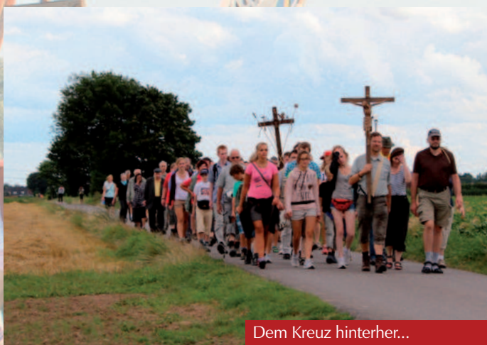
Dem Kreuz hinterher...

Wichtig ist, dass sich das gemeinsame Tun nicht nur auf die reine Wallfahrtszeit beschränkt: „Man muss auch unterjährig Gelegenheiten