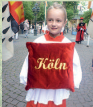
Das „Kölner Kissen“ – vor 20 Jahren verloren – jetzt wieder dabei, hier getragen von der jüngsten Teilnehmerin