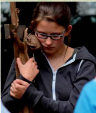
Die gemeinsame Wallfahrt schafft innige Beziehungen zu Glauben, Christlichkeit und Kirche insgesamt