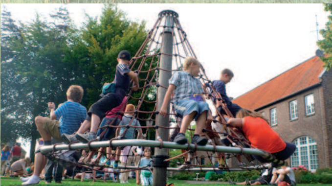
Klar, dass das Karussell nicht „links am Wegesrand liegen“ bleibt, sondern intensiv genutzt wird!