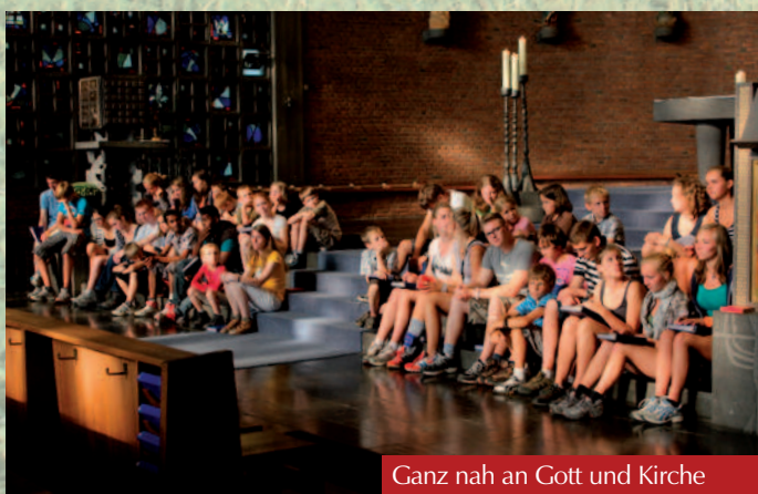
Ganz nah an Gott und Kirche