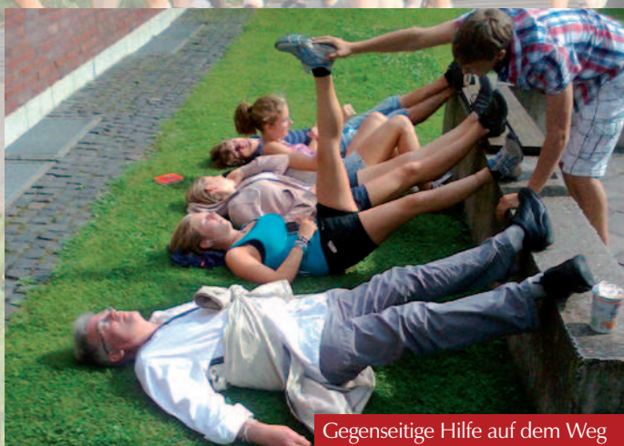
Gegenseitige Hilfe auf dem Weg