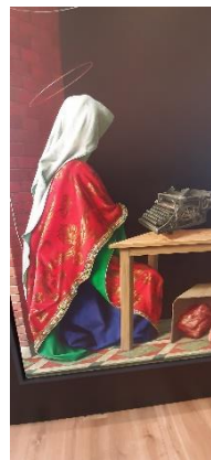
Michael Triegel, Deus absconditus