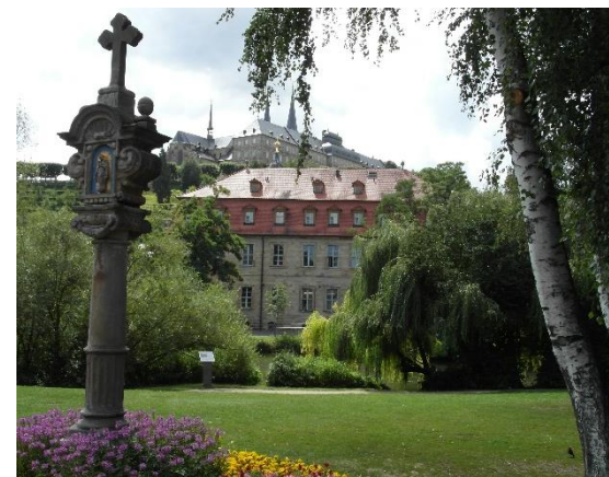
Impression aus Bamberg