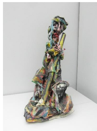
„Pilger“, Diözesanmuseum Würzburg