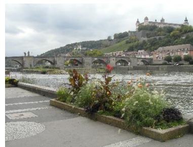
Würzburg, Blick über den Main