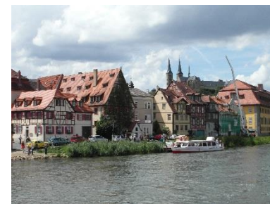
Bamberg, Blick auf die Altstadt