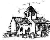
St. Kunibert, Sinzenich