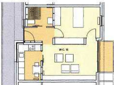
WOHNUNG 53,5 qm

Zusätzliche Leistungen im Haus können - gegen Bezahlung - von diversen Dienstleistern in Anspruch genommen werden. Der Malteser Hilfsdienst bietet etwa einen Notruf an, die Caritas ambulante Pflege, das Herz-Jesu-Stift stationäre Pflege und andere Dienste, wie Mahlzeiten, Reinigung, usw..