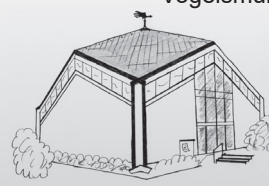
St. Josef Vogelsmühle