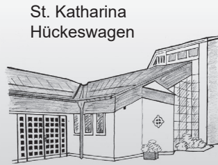
St. Katharina Hückeswagen