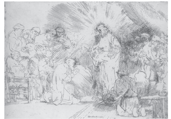
Rembrandt van Rijn

Pfingsten ist eine Herausforderung. Es geht um einen Geist, der aufsteht gegen die diabolischen Ungeister, die alles, was diabolisch bedeutet, durcheinanderwirbeln wollen. Von Disruption ist die Rede, also Unterbrechung und Zerstörung. Pfingsten verspricht einen Geist der Konstruktion, der aufbauen, nicht zerstören will. Beim Abschied hatte Jesus versprochen, ihnen einen Beistand, also einen Geist an die Seite zu stellen, der sie erinnern, stärken und ermutigen will. Einen Geist der Wahrheit, der diese Welt ihrer Unwahrheit überführen wird. Der Auferstandene spendet den Jüngern diesen Lebensgeist gegen die Mächte des Todes.