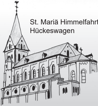
St. Mariä Himmelfahrt Hückeswagen