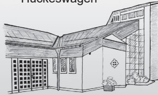
St. Katharina Hückeswagen