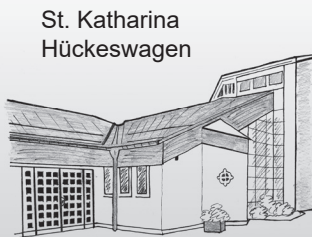
St. Katharina Hückeswagen