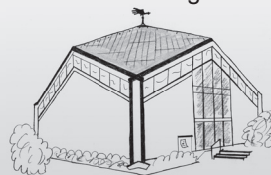
St. Josef Vogelsmühle