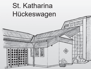
St. Katharina Hückeswagen