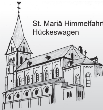
St. Mariä Himmelfahrt Hückeswagen