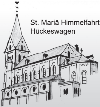
St. Mariä Himmelfahrt Hückeswagen