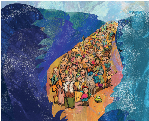
Lösung: Basecap und Nachziehhülle, ein Reh und ein Tennisschläger

lassen wollten. Da ließ Gott das Meer zurückkommen, und die Ägypter mussten ertrinken. So rettete Gott das Volk Israel und befreite es aus der Gefangenschaft der Ägypter. Eine tolle Geschichte. Im Bild sind vier Fehler, findest du sie?