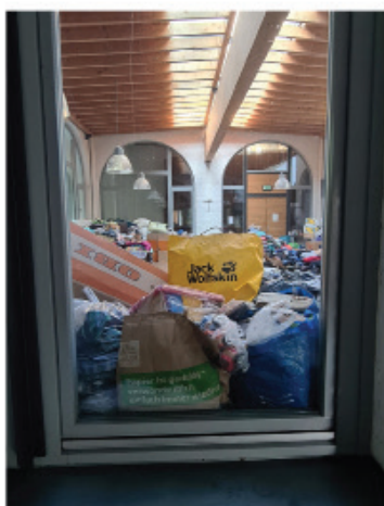
Hilfsbereitschaft nach der großen Flutkatastrophe 2021