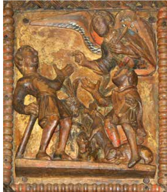
Verkündigung, Köln, Sankt Maria im Kapitol Mittelalterliche Darstellung in einer Holzür

Doch die Aufforderung „Fürchte dich nicht“ bedeutet nicht, dass wir unsere Augen vor dem Unrecht verschließen oder passiv bleiben sollen. Im Gegenteil: Sie lädt uns ein, unsere Hände und Herzen für den Frieden zu öffnen. Weihnachten ist die Zeit, in der wir besonders an un-