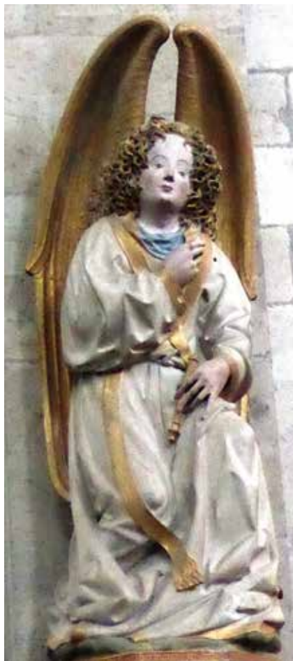
Das Bild zeigt den Verkündigungengel Gabriel aus der Verkündigungsgruppe an den beiden westlichen Vierungspfeilern in St. Kunibert; entstanden 1439, zugeschrieben dem Dombaumeister Konrad Kuyt

„Fürchtet euch nicht!“ Und er gibt ihnen den Auftrag, den Jüngern die Botschaft zu verkünden, dass Jesus sie in Galiläa erwarte. [Mt 28,10]