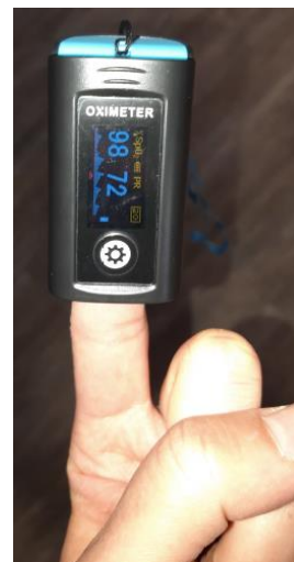
Abbildung 4: Pulsmessgerät

Die Rucksäcke werden in beiden Kirchen griffbereit angebracht.