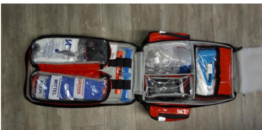
Abbildung 2: geöffneter Rucksack