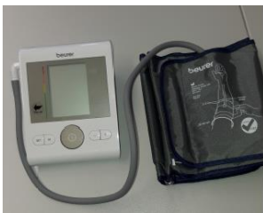
Abbildung 3: elektr. Blutdruckmessgerät