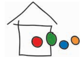
Katholisches Familienzentrum «St. Martinus» im Kreuz-Köln-Nord