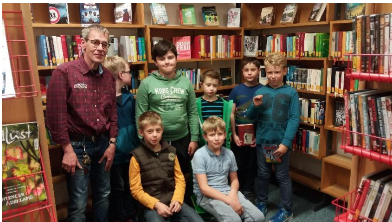
Abbildung 3: Jungenabend