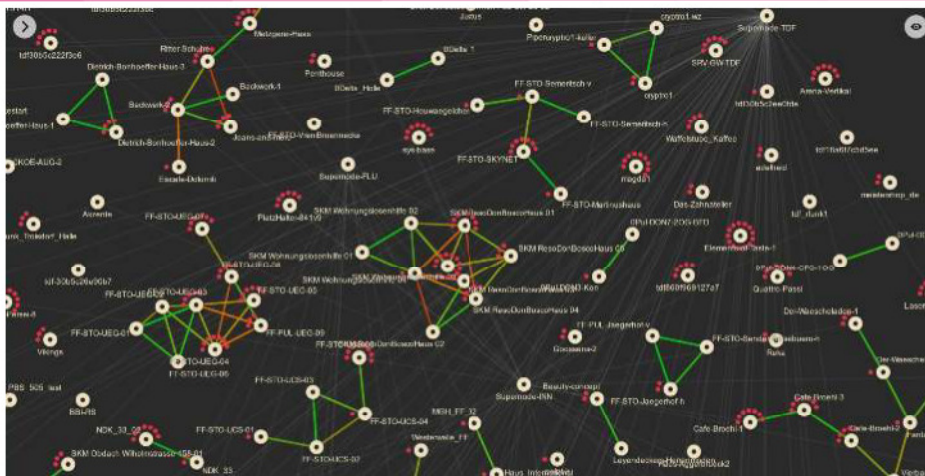
So sieht die Darstellung der Knotenpunkte in Stommeln aus.

dadurch bemerkt, dass die abendliche Traube der Internetuser vor der Bücherei und am Dorfanger in den letzten Wochen deutlich kleiner geworden ist. Die Bewohner der erwähnten Standorte können nun praktisch von zuhause aus surfen und müssen nicht mehr in der Kälte sitzen. Jeder rote Punkt um einen Stern/Router ist ein eingeloggtter Internetuser.