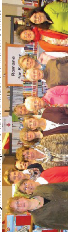
Gründung der Arbeitsgemeinschaft der Katholischen Öffentlichen Büchereien Pulheim/Frechen/Bergheim-Glessen