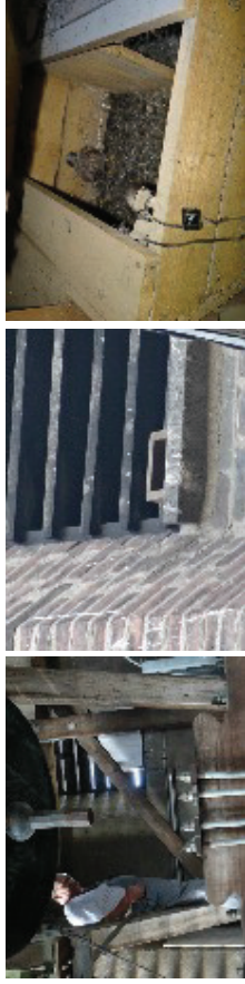
Turmfalkenaufzucht aus dem Kirchturm St. Martinus per Webcam in unserem Fenster. Idee: Peter Steger.