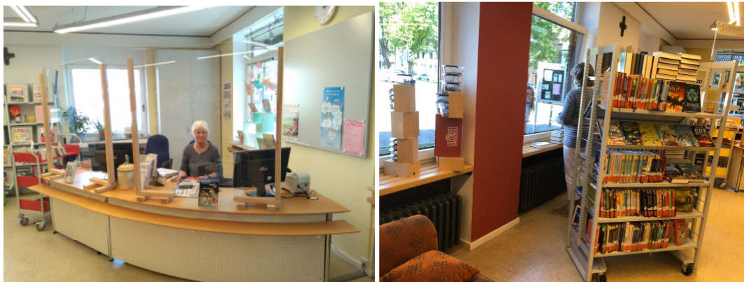
Helga Rochelt hinter unseren Distanzfenstern ; an das Fenster gerolltes Regal während der Fensterausleihe

Sie können uns nun wieder zu den normalen Öffnungszeiten mit Maske besuchen – übrigens: Mund-Nase-Bedeckungen können bei uns gegen Spende für die Bücherei erworben werden!