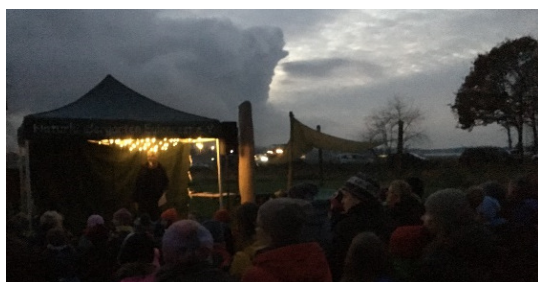
Mutiges Eulennest draußen mit der Eule