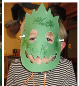
Räuberhöhle sucht die Dinos