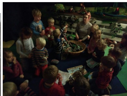
???Kids im Regenbogen