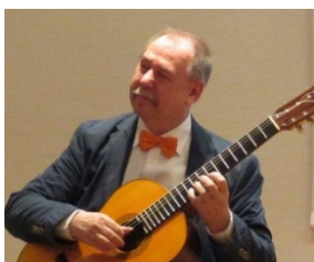
Uhr - 19 Uhr, ng: Kath. Kirch