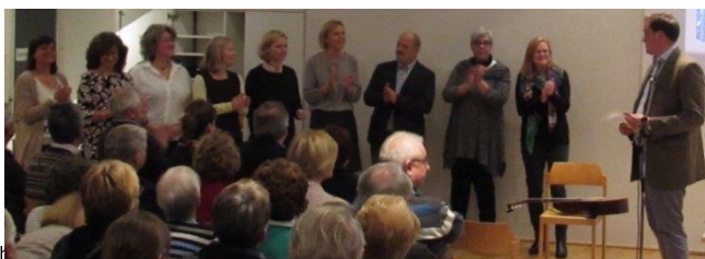
g 10 Uhr - 1