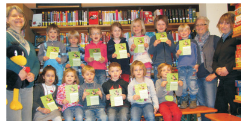
Die Kinder der Kath. KiTa St. Bruno und des Naturkindergartens Eulennest sind Bib(liotheks)fit 2013