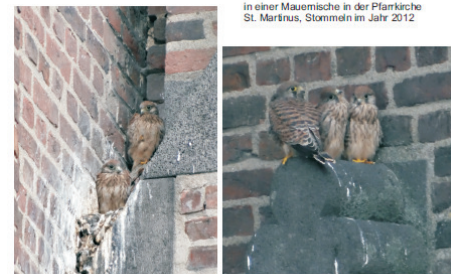
in einer Mauernische in der Pfarrkirche St. Martinus, Stommeln im Jahr 2012