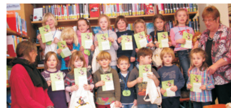
Die Kinder der Kath. KiTa Mariengarten sind Bib(liotheks)fit 2013