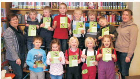
Die Kinder der Ev. KiTa Regenbogen sind Bib(liotheks)fit 2013