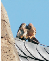
Schön ist's auf dem Blitzableiter