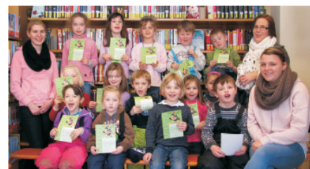
Die Kinder der Städtischen KiTa Räuberhöhle sind Bib(liotheks)fit 2013