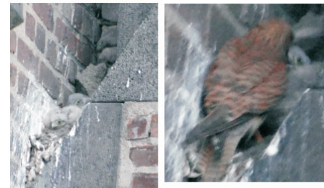
Aufzucht in einem unkomfortablen Nest

Idee/Realisation: Peter Steger, Technik: Zöllner SP, TV-Video-HIFI, Nettogasse 2, Pulheim-Stommeln, Stand: 14. Mai 2013