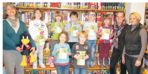
Die Kinder des Kindergartens "Alte Mühle" e.V. sind Bib(liotheks)fit 2013