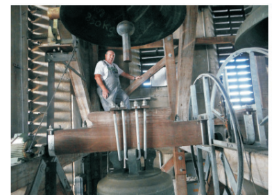
inmitten himmlischen Getöses