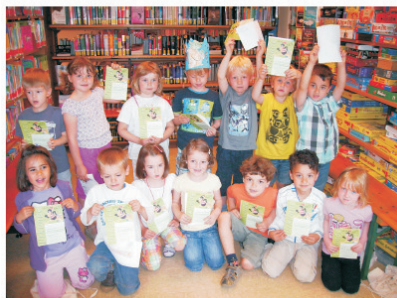
Die Kath. KiTa St. Bruno und der Naturkindergarten Eulennest sind Bib(liotheks)fit 2012

Bibfit der „Bibliotheksführerschein für Kindergartenkinder“