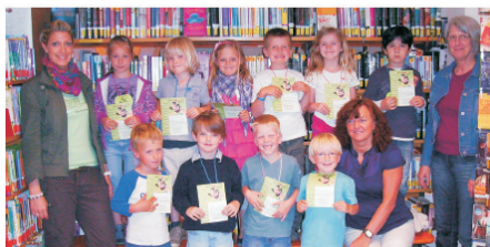
Der Mariengarten und die Alte Mühle sind Bib(liotheks)fit 2012