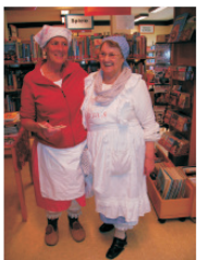
Stommeln's Waschweiber vom Marktplatz