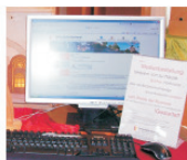
Medienbestellung zu Gunsten der Stommeln's Bücherei