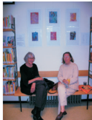
Frauenbilder mit Frauen

Ausstellung 15.05 bis 6.07.2012 Vernissage am Tag des Offenen Stommeln Samstag, den 12.05.12 von 12 Uhr - 18 Uhr