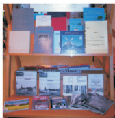
Bücher über Stommeln