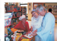
Zeitreisende aus Stommeln