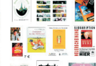
Medien von Stommeln über Stommeln zum Stommeln