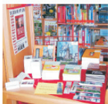
Stommelnlesezeichen, -memory, -kirchenführer...