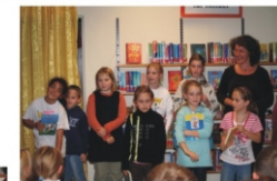
„Fliegender Wechsel“ – der Vorlesemarathon von Kindern für Gleichaltrige zur Langen Nacht der Bibliotheken am 26.10.2007 in der Öffentlichen Bücherei St. Martinus Stommeln

Wird finanziell unterstützt durch: Stommeln e.V., die die Regeln und Inhalte des Buches abhaken verantwortlich angelehnt an der Verleger: Arena, Limes, Patina, Plois, Tübingen