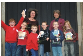
„Fliegender Wechsel“ – der Vorlesemarathon von Kindern für Gleichaltrige zur Langen Nacht der Bibliotheken am 26.10.2007 in der Öffentlichen Bücherei St. Martinus Stommeln