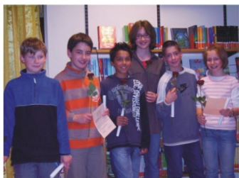
„Fliegender Wechsel“ – der Vorlesemarathon von Jugendlichen für Gleichaltrige zur Langen Nacht der Bibliotheken am 26.10.2007 in der Öffentlichen Bücherei St. Martinus Stommeln

Jugendliche ab 14 Jahren lesen für ihre Altersgruppe Texte in den Sprachen z. B. Englisch, Französisch, Italienisch und Latein und werden durch Muttersprachler, wo möglich, geschult.