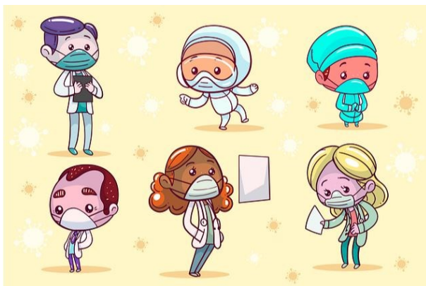
Mund – Nasenschutz tragen