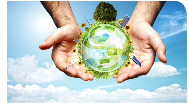
Bild: „Globo verde“ by Olearys / CC-by 2.0 / Quelle: flickr.com In: Pfarrbriefservice.de Buchumschlag Suhrkamp/Insel Bild Barbara Buys: © Isolde Ohtbaum