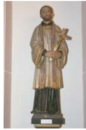
Hl. Franz Xaver

Hl. Nikolaus und Hl. Martin als Bischöfe dargestellt. (Holz, ohne Fassung Höhe ca. 1,40 m 2. Hälfte des 19. Jh.)