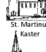
St. Martinus Kaster