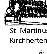
St. Martinus Kirchherten