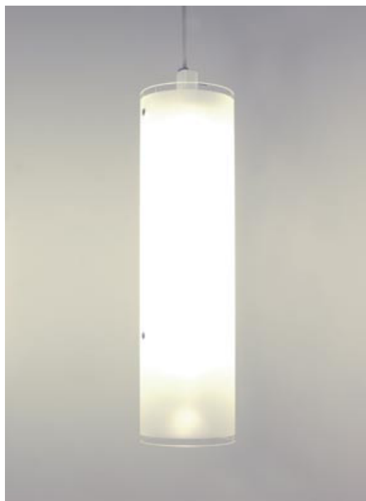
WM 06/P 1-1 H 2 T

Kleine 1-flammige, energiesparende Glaszylinderpendelleuchte mit einem hohen Lichtstrom von 4300 lm. Durch die Reflektoreinheit erfolgt der Lichtaustritt nach oben, mittig und nach unten. Das Pendelrohr ist RAL 9003 pulverbeschichtet.