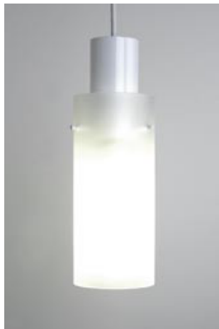
WM 09/P 1 T

Kleine 1-flammige Glaszylinderpendelleuchte, mit Reflektoreinheit. Der Lichtaustritt erfolgt nach oben, mittig und nach unten. Das Pendelrohr ist Standard DB 701 pulverbeschichtet.