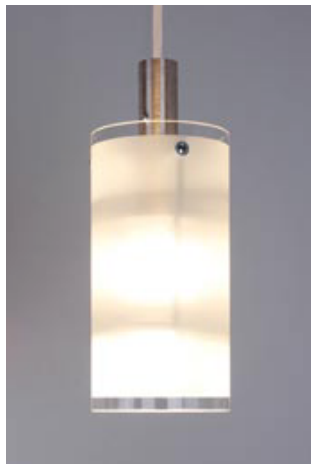
WM 08/P 1 T

Kleine 1-flammige Glaszylinderpendelleuchte, mit Reflektoreinheit. Der Lichtaustritt erfolgt nach oben, mittig und nach unten. Das Pendelrohr ist Standard DB 701 pulverbeschichtet.