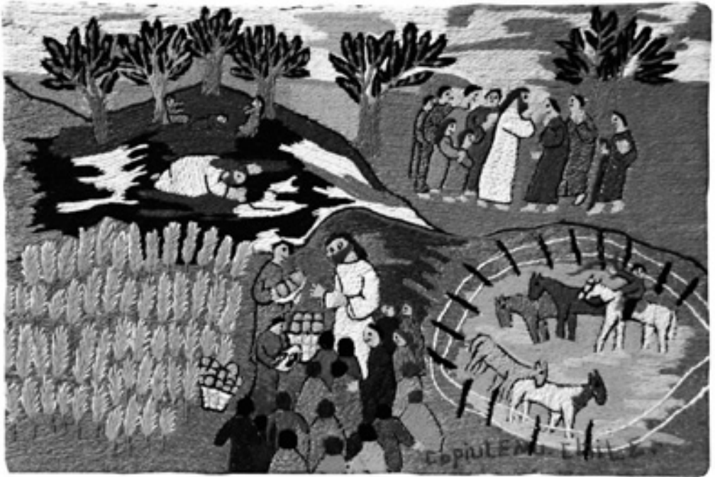
Bildtitel: Wie viele Brote habt ihr? , Las Bordadoras de Copiulemu