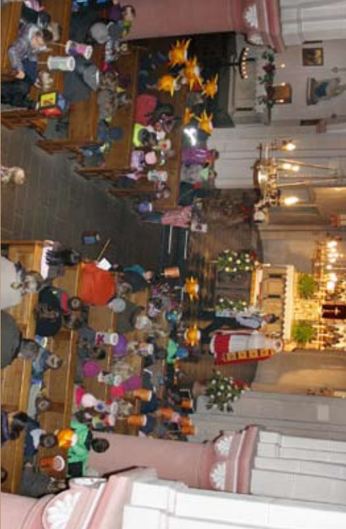
Andacht an St. Martin