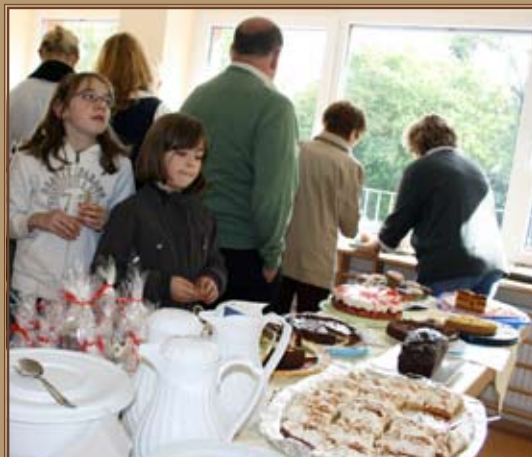
Oh, sieht das lecker aus! Was nehm ich nur?