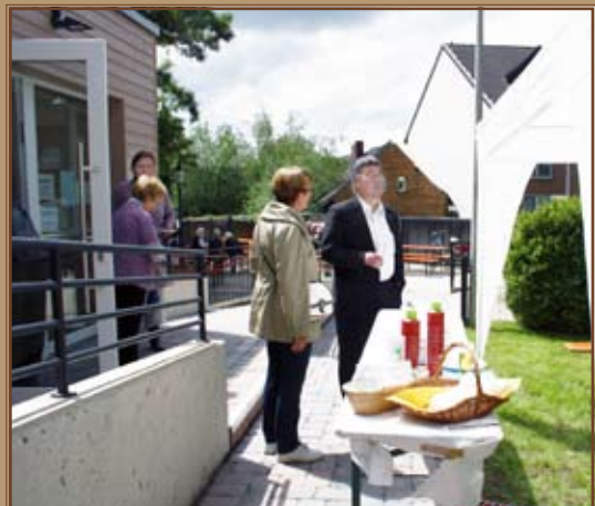
Fronleichnam spielte das Wetter mit!