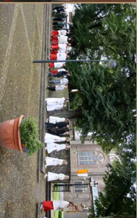
Prozession an Fronleichnam