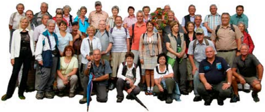
Alle Fotos der Kevelaer-Wallfahrt wurden aufgenommen von Herrn W. Rohmann Liblar

Anschließend gingen wir zusammen den Kreuzweg. Das Kreuz, auch immer ein aktuelles Sinnbild. Wir alle tragen unser Kreuz. Tragen wir unser Kreuz im Vertrauen auf Gottes Hilfe.