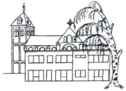
Grafik: I. Wallraff

Die Freundlichkeit Gottes segne dieses Haus. Das Lächeln des Himmels sei über diesem Haus. Die Güte des liebenden Gottes sei in diesem Haus. Haussegen aus Schlesien