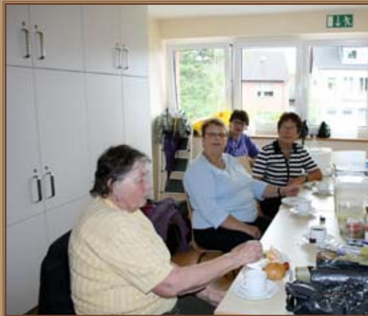
Verdiente Pause für die Küchenfeen