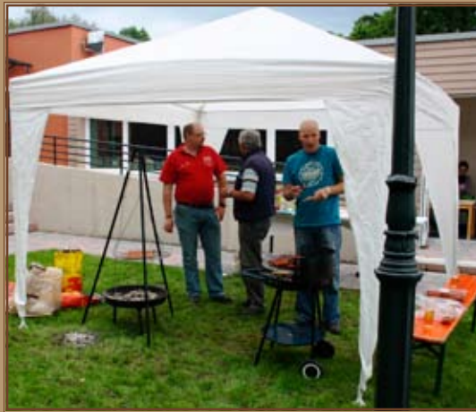
Wichtiges Team für alle: Die Männer vom Grill