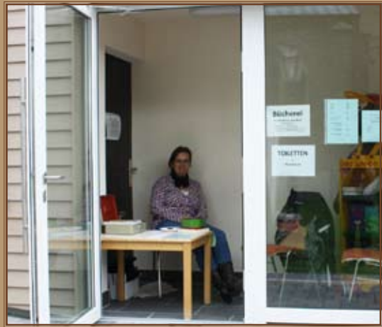
Die Frau mit dem einnehmenden Wesen