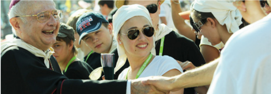
"Hören, was bewegt": Erzbischof Zollitsch im Gespräch mit Jugendlichen bei der Ministrantenwallfahrt nach Rom im August 2010.

kirchensite.de ONLINE MIT DEM BISTUM MÜNSTER