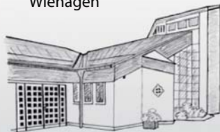
St. Katharina Wiehagen