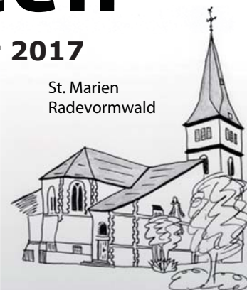
St. Marien Radevormwald