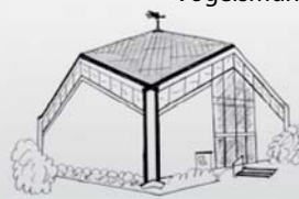
St. Josef Vogelsmühle