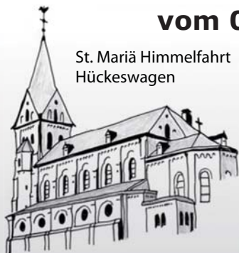
St. Mariä Himmelfahrt Hückeswagen

vom 02. Dezember 2017 bis 08. Dezember 2017