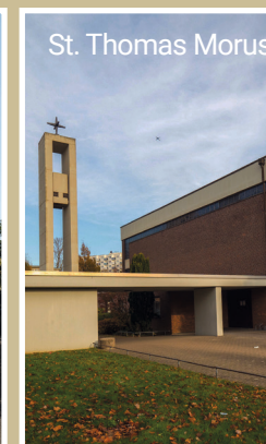
St. Thomas Morus